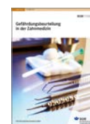
Gefährdungsbeurteilung in der Zahnmedizin (BGW 04-05-020)

Um Infektionen zu vermeiden, müssen Sie Maßnahmen festlegen, die vorrangig technischer, dann organisatorischer und/oder, falls nicht anders möglich, personenbezogener Art sind. Welche Maßnahmen das im Einzelnen sind, hängt vom Tätigkeitsspektrum Ihrer Praxis ab. Daher sind in der Tabelle beispielhaft nur einige Mindestanforderungen aufgeführt.